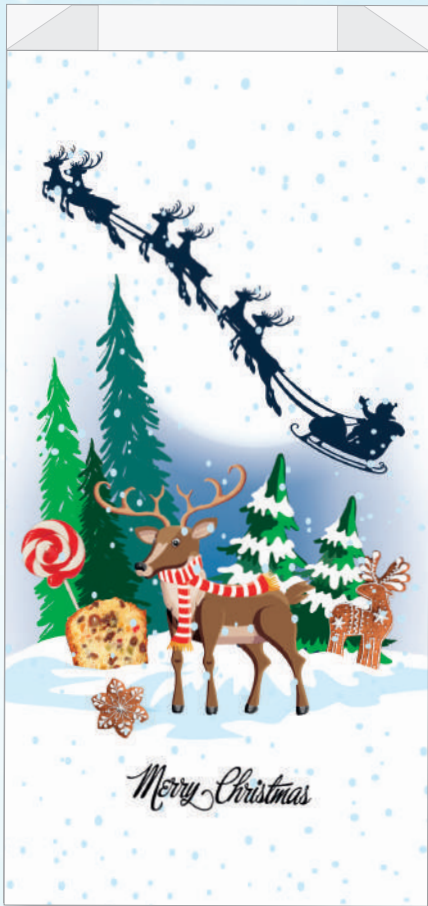
cm. 22 x 44