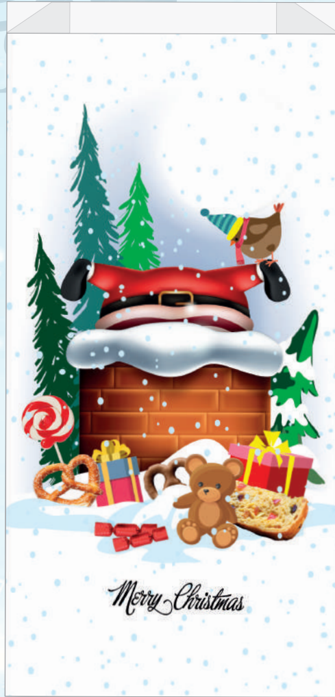
cm. 25 x 50